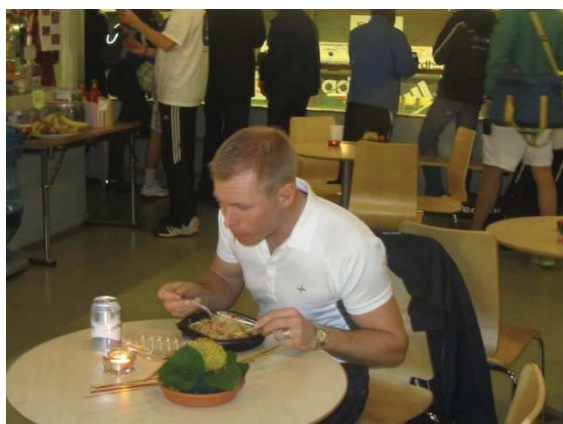
... Chaufförer som kastar i sig lite mat innan det är dags för nästa körning!