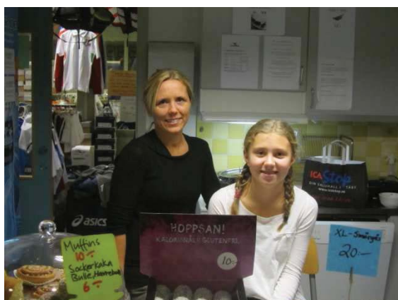
... De som hjälper till i caféet.