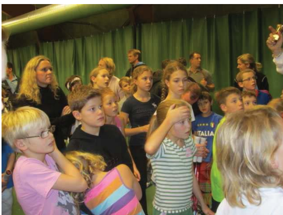
Någon som tror att det var ett tufft jobb att vara tävlingsledare?