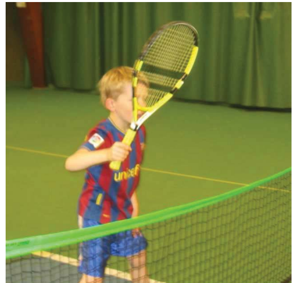
Det är det här som kallas offensiv dubbel!