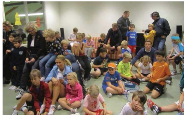
Det synst inte på bilden, men mot slutet av "Toddlotteriet" var det inte mycket luft kvar i rummet...