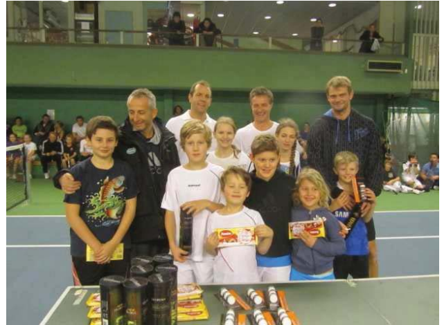
De yngre valde gärna chokladkakorna, de äldre hade inget emot ett bollrör!