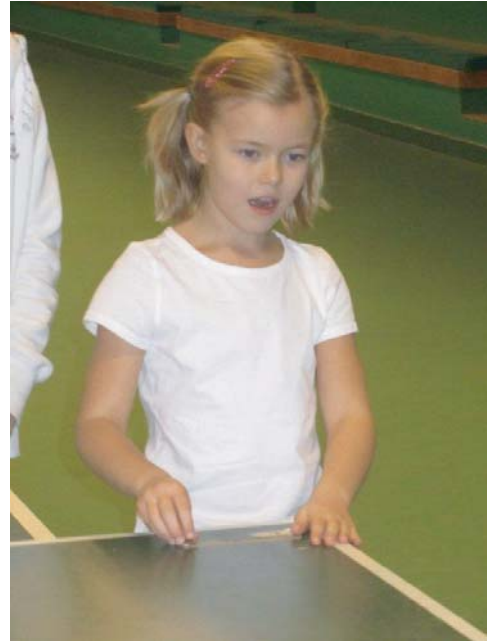
Det gäller att hålla tungan rätt i mun i kronpingisen