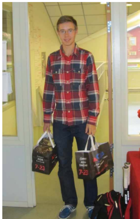
... De som beställer och hämtar mat till domarna!