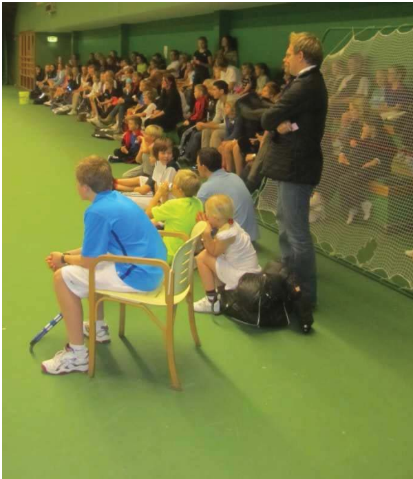
Det var fullt på läktaren under prisutdelningen!