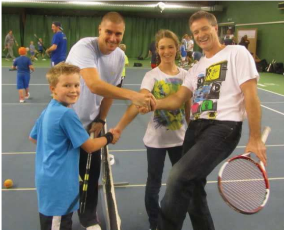
Inte lätt att se vilka som vann här!

En familjefest med minitennisdubbel, femkamp, frågesport, servetävling, "Toddlotteriet", fika, godispåsar och mycket mer!