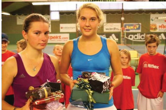
Det är möjligt att finalisterna inte åt middag tillsammans på kvällen...