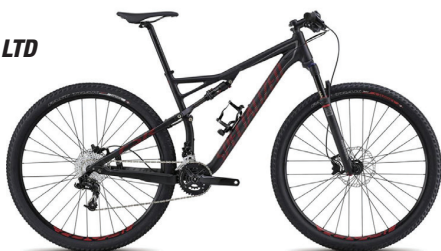
SPECIALIZED EPIC COMP PRIS 27.000 KR