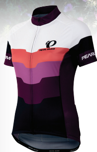
PEARL IZUMI ELITE LTD TRÖJA DAM PRIS 900 KR