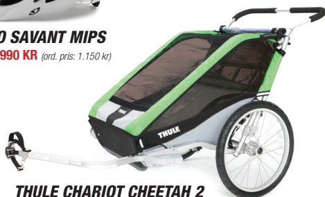
THULE CHARIOT CHEETAH 2 PRIS 5.900 KR