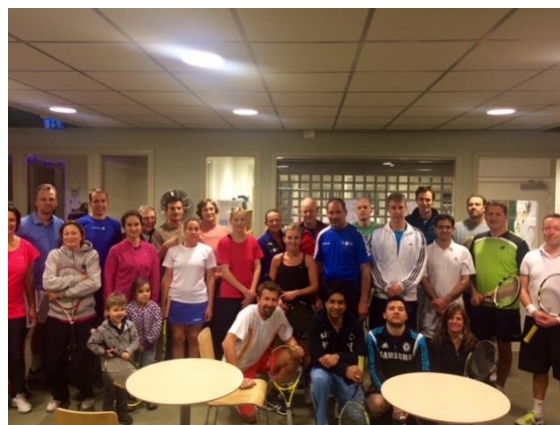
I januari var det 25 spelare som deltog under matchspelsdagen...

Utöver den ordinarie träningen har vi bland annat arrangerat två matchspelsdagar för deltagarna i vuxenkurserna. Dessa ägde rum i januari respektive mars månad där totalt 40 spelare deltog. Tanken med dessa tillfällen är att man ska få träffa andra i kurserna, dela tenniserfarenheter och ha roligt tillsammans samtidigt som man spelar dubbelmatcher med blandade med- och motspelare. Sådana här dagar tillsammans med evenemang som KM och divisionsspelet är utmärkta exempel på tillfällen där man har möjlighet att träna på att bli bättre på att spela match. Något som inte är helt lätt utan matchrutin med tanke på serve, psykologi, etc.