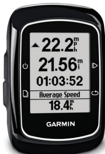
GARMIN EDGE 200 PRIS 1.250 KR