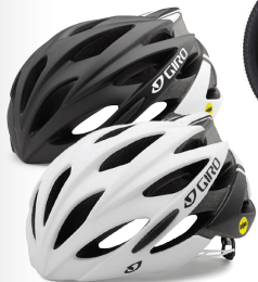
GIRO SAVANT MIPS PRIS 990 KR (ord. pris: 1.150 kr)