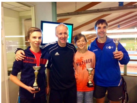
Bergboms besegrade Bornefalks i Generationsdubbel A-finalen.

Det var väl ingen som på allvar trodde att Grisen skulle få triumfera i någon av de klasser han medverkade i? Nej jag tänkte väl det. Oj så rätt vi hade!