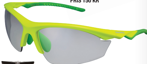
SHIMANO EQUINOX 2 PRIS 950 KR