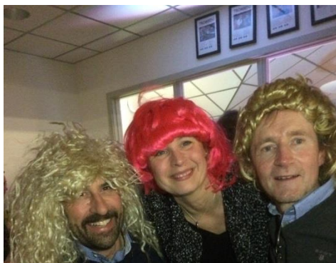
KM avslutades traditionsenligt med en KM-fest som samlade 150 gäster. KM i pingis, Sten, Sax, Påse, Karaoke, musikunderhållning och en härlig buffé från ICA Stop stod på programmet.