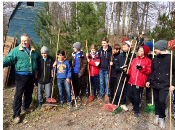
Finn ett fel!