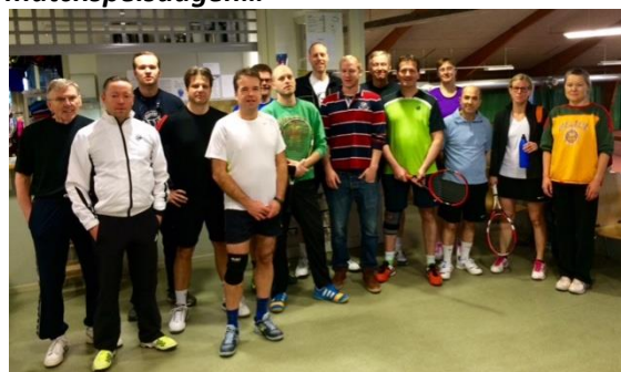
... och i mars totalt 15 spelare. Tack till alla som medverkade!