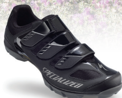
SPECIALIZED SPORT MTB PRIS 950 KR