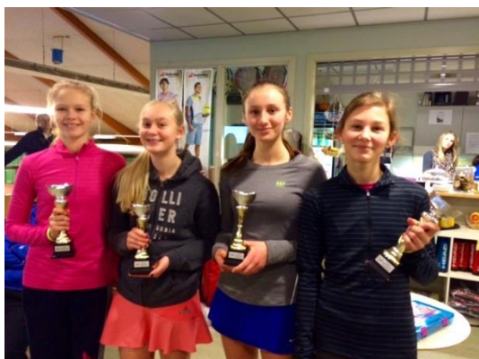
Vem förlorade egentligen Damdubbel A-finalen? Av bilden att döma, ingen!