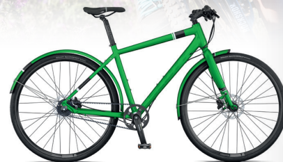
SCOTT SUB SPEED 10 PRIS 11.000 KR