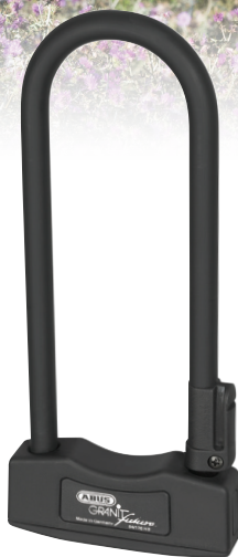
ABUS GRANIT FUTURA PRIS 900 KR