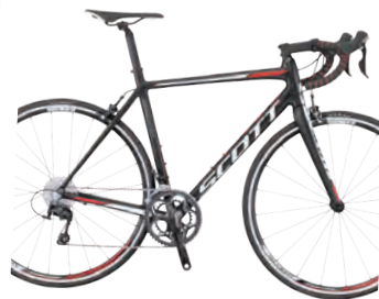
SCOTT SPEEDSTER 20 PRIS 12.990 KR