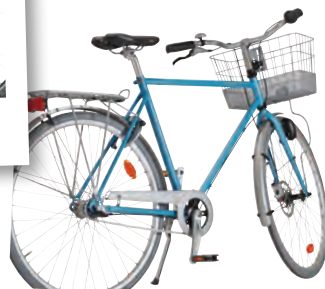
SKEPPSHULT FAVORIT 7-VXL PRIS 7.490 KR