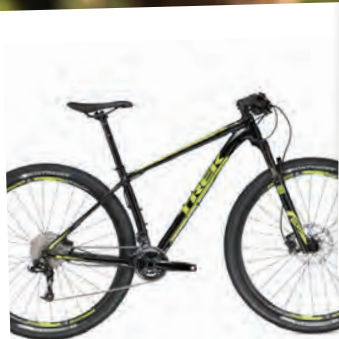
TREK SUPERFLY 6 PRIS 14.990 KR