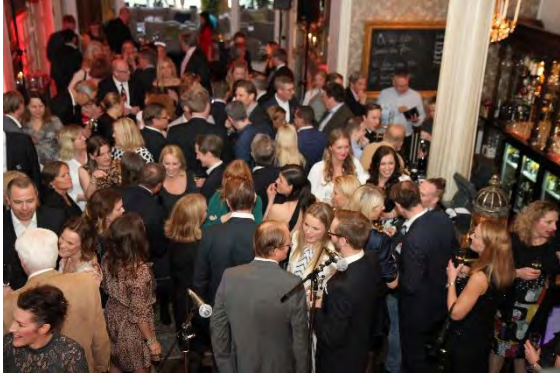
Sorlet var precis som det ska vara på en klubb- och mingelfest!