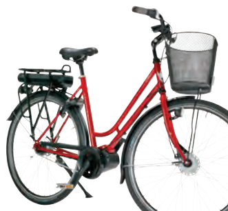
SKEPPSHULT CYK-EL 7-VXL PRIS 24.490 KR