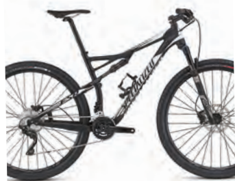
SPECIALIZED EPIC COMP PRIS 29.990 KR