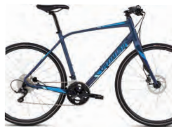
SPECIALIZED SIRRUS ELITE DISC PRIS 8.990 KR