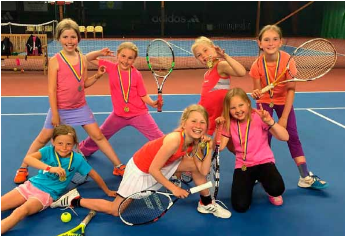
Det är kul att vara med i Skandiamäklarna Täbys Tennisskole-KM!

Tennisskole-KM arrangerades i december och juni. Målsättningen med evenemanget är att låta de som inte tävlar regelbundet få upptäcka hur kul det kan vara att spela match. Samtliga deltagare fick medalj. Sista dagen stod korvätning och medaljutdelning på programmet. Båda tävlingarna samlade cirka 50 deltagare.