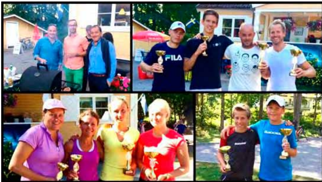
Bilder från utomhus-KM. Förväntansfulla festdeltagare och glada pristagare.

Klubbmästerskapen har blivit ett mycket viktigt socialt evenemang som samlar spelare i alla åldrar och nivåer. Klasser som Mixeddubbel A o B, Generationsdubbel A o B, Damsingel A, B och C, Herrsingel C har fått till följd att alla kan vara med och tävla. KM samlade deltagare alltifrån spelare med WTA- o ATP-ranking, elitveteraner, vuxenkursdeltagare och rena nybörjare.