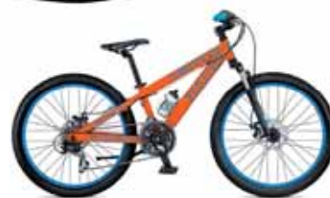
SCOTT VOLTAGE JR 24 PRIS 4.500 KR