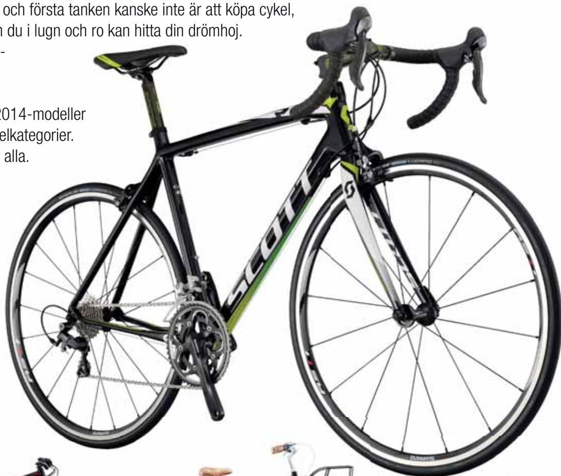
SCOTT CR1 10 PRIS 20.000 KR