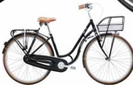
TREK OSLO 7-VXL PRIS 6.500 KR