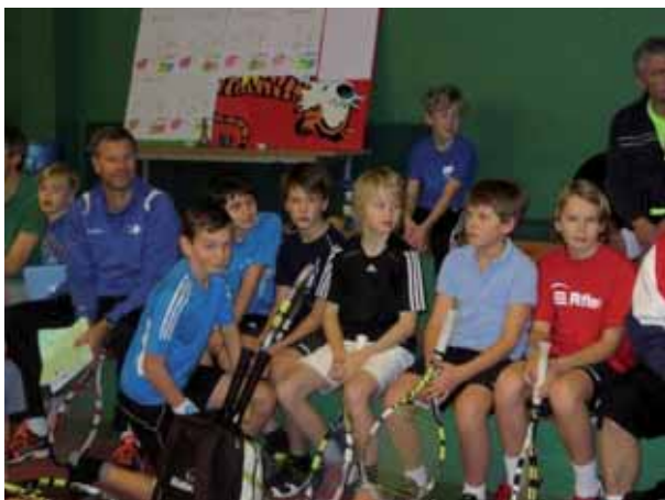
När ska vi få spela?