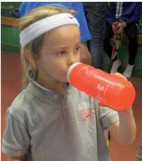
"Hm, vilken gren ska jag välja nu?"