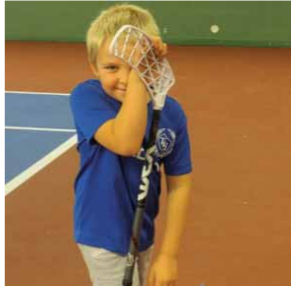
"Jag vet inte om jag vill vara med på bild".