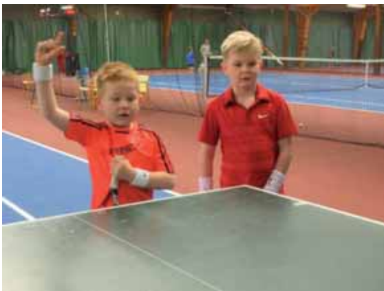
Som ni ser kräver Kronpingisen mycket inlevelse!