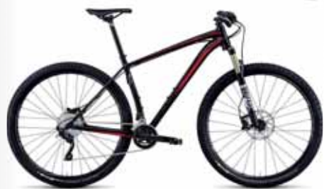
SPECIALIZED CRAVE PRO 29 PRIS 16.500 KR