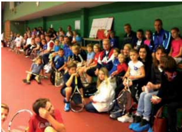
Femkamp, minitennisdubbeltturnering, frågesport, lotterier, korv- o lussekattafika, prisutdelningar stod på programmet.