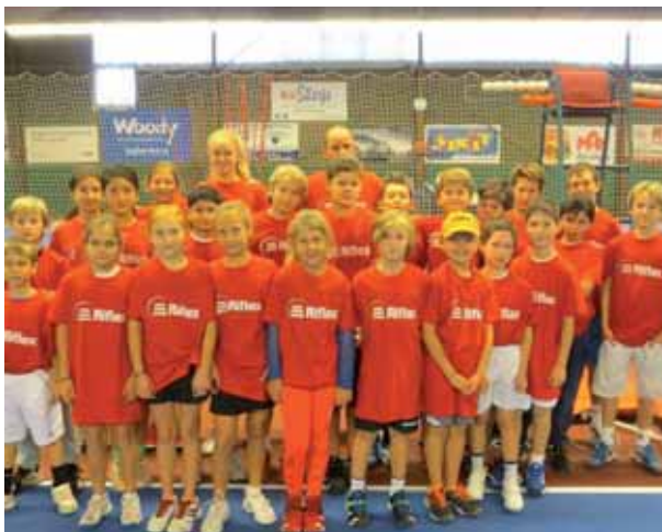
Ni som varit på plats under Stockholm Ladies och elitseriespelet, har säkert sett att vi har världens bästa bollkallar!