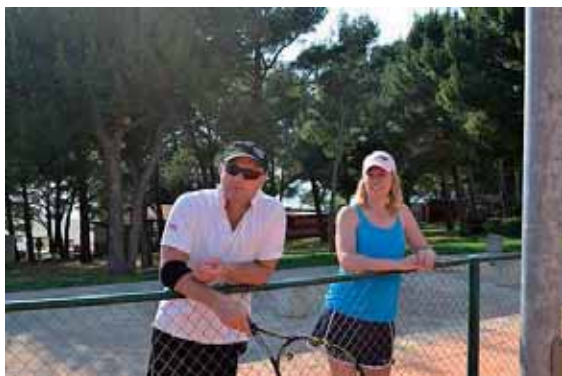
Vi vill också spela!