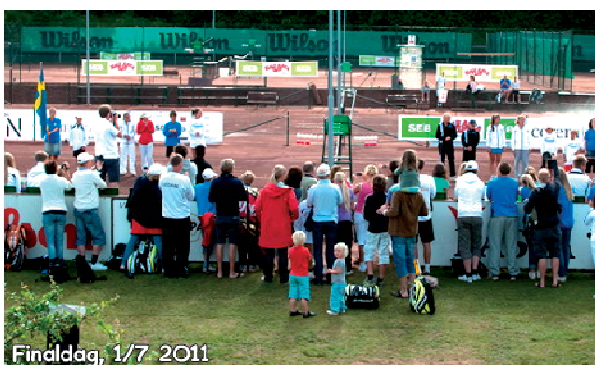
Finaldag, 1/7 2011

SEB Kalle Anka Cup har en väldigt trevlig och annorlunda atmosfär med en hel del kringaktiviteter. Det är en upplevelse bara att få vara med.