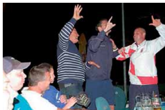
Banketten sista kvällen var lite stel...