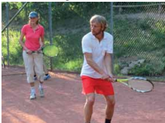
Inget fel på koncentrationen här inte!