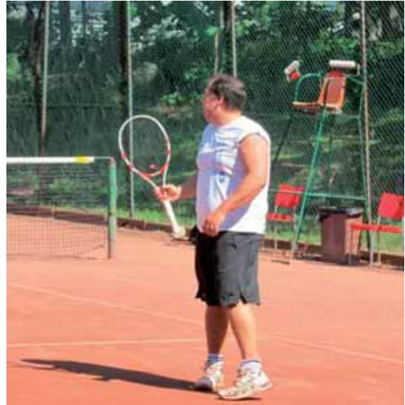
"Dömde du ut den där?"