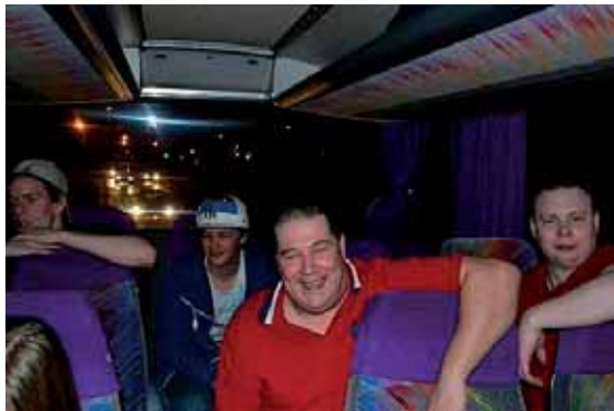
Herregud ska han aldrig sluta prata!?