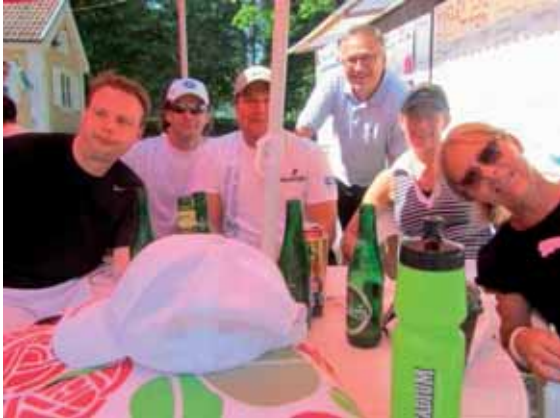
En del av lördagstennisspelarna värmdes upp med att titta på finalerna i Reflex Open!