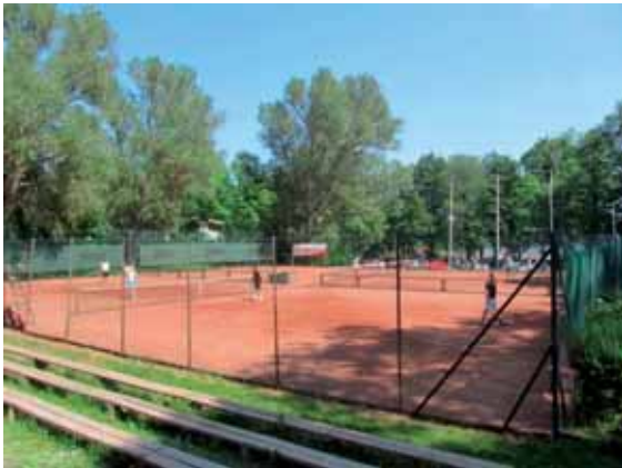
Direkt efter finalerna i Reflex Open fylldes banorna av lördagstennisspelare.