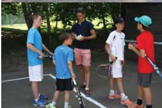
Våra bollkallar skötte sig suveränt och lite "häng" på den nymålade minitennisbanan hanns också med!