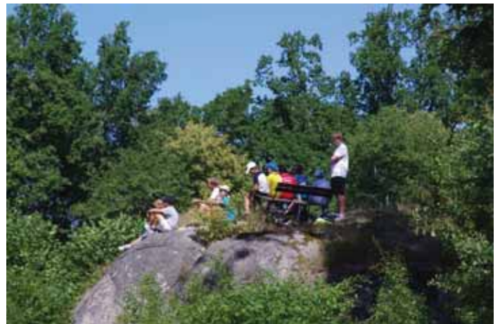
På bilden sitter stora delar av gruppen och hejar fram vår spelare.