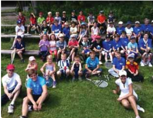
Nästan 200 ungdomar deltog i årets sommarläger!

Helt otroligt att få ta del av den spelglädje, den aktivitet och sprudlande tennisiver som fullständigt "bubblade över" på Näsaäng denna heta sommar. Massor av tennis med glada, spelsugna, matchivrige, lyhörda, trötta och törstiga små och större hjältar har glatt oss tränare denna härliga sommar. Tack till alla tränare, elever och cafépersonal som gör lägerveckorna till fantastiska dagar.