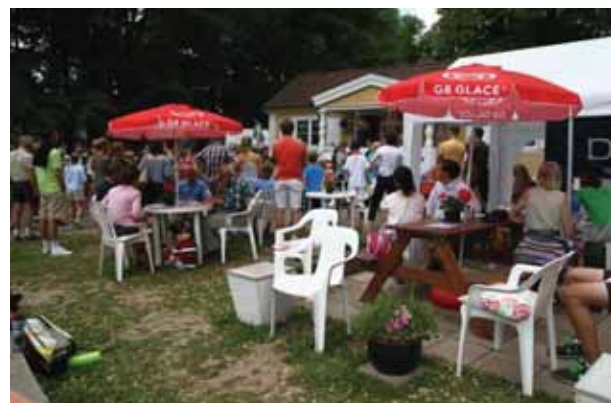
NPTK hälsar spelare, ledare, publik och samarbetspartners välkomna tillbaka nästa år!