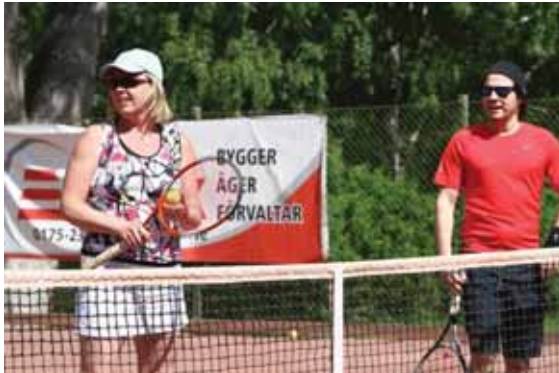
Lördags tennisen spelades under strålande väder hela sommaren.

När jag tänker tillbaka på fjolåret minns jag hur jag i snitt var tredje/fjärde dag fick ta fram svamparna och göra mitt yttersta för att rädda våra vackra Näsaängsbanor från vätan som mellan varven öste ner från den molntäckta himlen. Denna sommar har det glädjande nog varit raka motsatsen. På de drygt 150 dagar Näsaäng varit öppet denna säsong har jag bara vid ett enda tillfälle fått ta till svamparna. Som ni förstår har förutsättningarna för att spela tennis varit extremt gynnsamma. Något som också speglar antalet strötimmor, spelare i drop-in aktiviteter, deltagare i KM, etc. Här nedan kommer en sammanfattning av sommaren på Näsaäng.