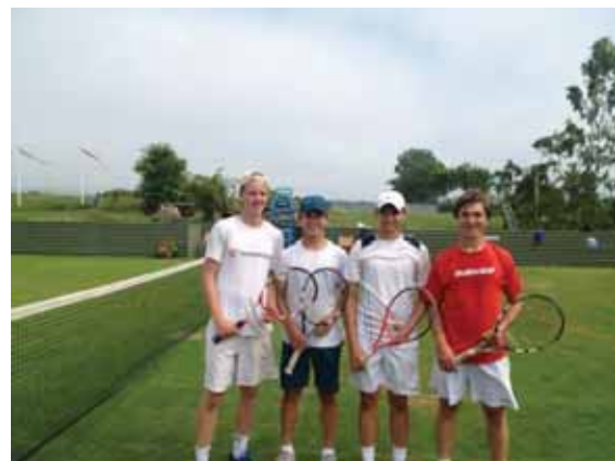
Vårt duktiga P-15 lag som vann Lag-SM silver i vintras hann med att prova på grässpel under sin Båstads-vistelse.

Vidare ska nämnas att både herr och damlaget vann sina respektive serier utomhus.