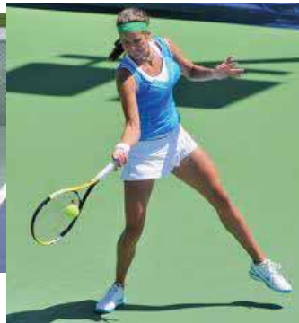
Semi öppen fotställning