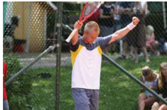
Morgan hade dock lösningar på allt och kunde till publikens jubel sträcka armarna i luften.